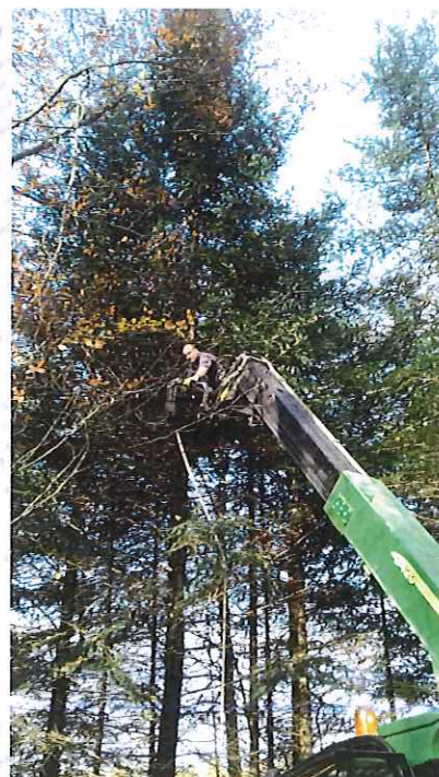
Le sapin abattu par Floranim dans les bois de l'Abbaye