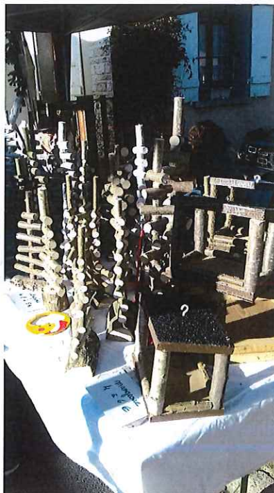
Nichoires et mangeoires à oiseaux