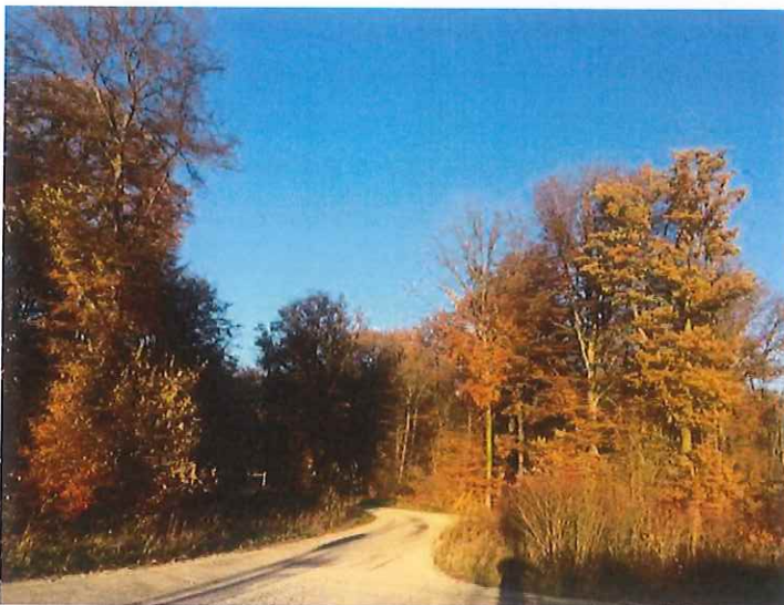
La forêt d'Emagny après de longs mois de sécheresse

On se souviendra de cette année 2018 ponctuée par une sécheresse particulièrement sévère où chaque citoyen a dû s'adapter aux restrictions d'eau afin de préserver l'environnement et par des tensions politiques et sociales (gilets jaunes). Certes, le pouvoir d'achat des personnes en difficulté est à revoir et le référendum d'initiative citoyenne (RIC) est un dispositif de démocratie directe de saisir le peuple par référendum. Il est inscrit dans la constitution de la 5 e République et il est indiqué « que ce débat aussi nous allons l'avoir .. Et c'est un sujet que nous allons organiser ensemble partout en France ».