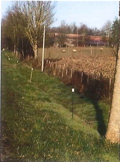
Des réflecteurs anti collision installés le long de la RD8 à la sortie d'Emagny

Chaque année, sur cette portion de route, un nombre important de collisions, 5 à 8 connues, entre véhicules et faune sauvage, sont recensées. Heureusement ces collisions n'ont jusqu'à présent provoqué que des dégâts matériels.